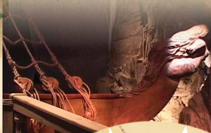
Image : tirée de la publication Mayday de Les Productions du train d'enter